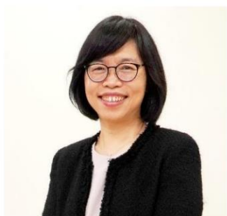
衛生福利部國民健康署 賈淑麗副署長

國立體育學院體育研究所碩士，曾任前行政院體育委員會科長、臺中市政府體育處處長、桃園市政府體育局副局長、教育部體育署主任秘書。房瑞文副署長自臺東師專畢業後原擔任小學教師，有感於臺灣體育亟需人才，爰於研究所畢業後於 87 年通過高考，從基層公務人員做起，在地方和中央機關任職，擁有豐富的教育及體育行政經歷。