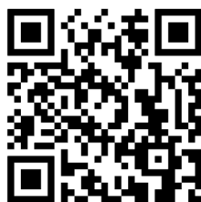
線上報名 QR code

線上報名連結 https://forms.gle/VK85tC8FitYJraGh7