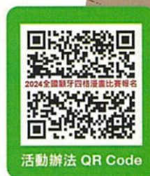
活動辦法 QR Code