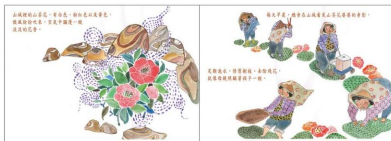
※範例作品：教育部反毒繪本—山茶花婆婆/洪孟真、呂舒婷