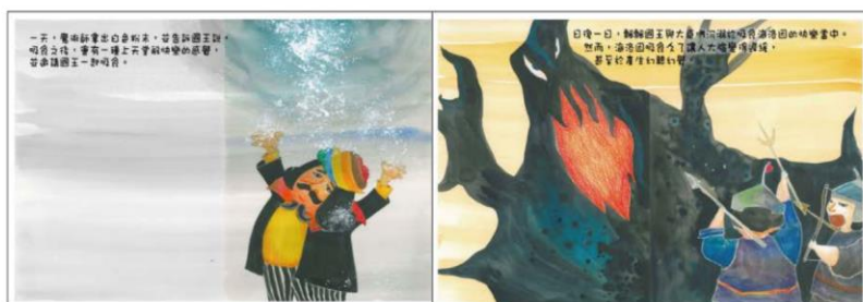
※範例作品：教育部反毒繪本—飄飄王國滅亡記/洪孟真、呂舒婷