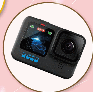
GoPro HERO12 Black 套組