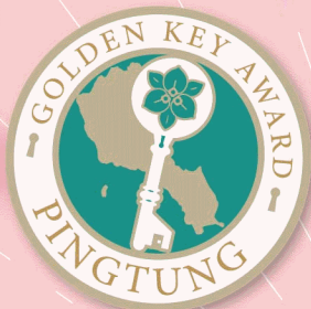
金鑰獎認證 雙人房住宿卷