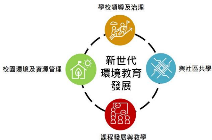
圖 1 全校式環境教育實施策略概念圖

(修改自 UNESCO 2018. Issues and Trends in Education for Sustainable Development . p. 47.)