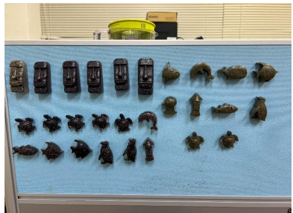
環保手作 DIY 課程(手工皂&固碳磁鐵)