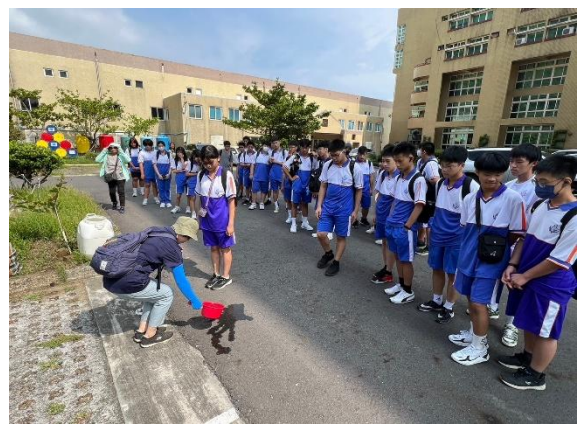
雨水公園戶外導覽