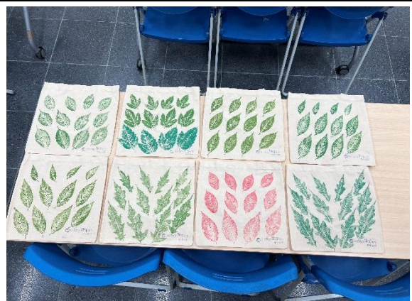
環保手作 DIY 課程(葉拓環保袋)