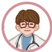
專家（司法詢問員、醫生、鑑定人等）

為被告辯護的辯護人，或是幫助你主張法律權利的告訴代理人，他們都是律師、都是法律專家。